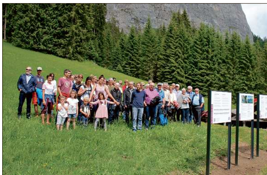
Pign e grond, da Flem e d'ordeifer, en tut 60 personas, ein separticipai alla spassegiada silla senda romontscha.