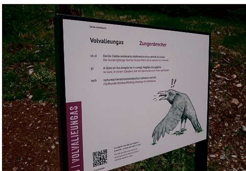
Tgi che contempla meglier il quac engarta il nuv che quel ha ella lieunga.