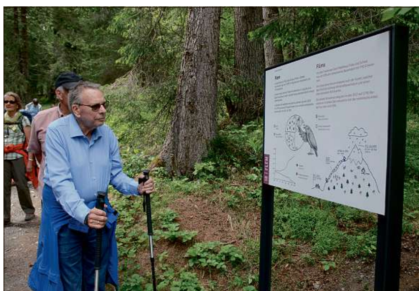
Tgi che pren peda per las informaziuns sillas 24 tablas ei surstauss.