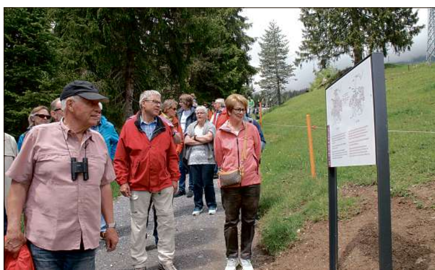
Viandonts contemplan ina dallas empremas tablas cun informaziuns dalla historia dil romontsch.