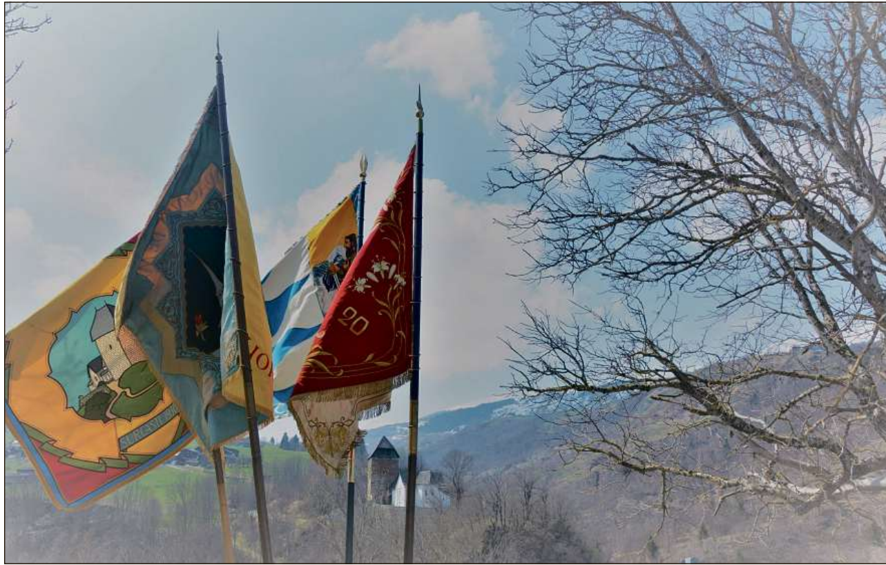
Las quater bandieras historicas dallas quater cumpignias da mats dueien puspei sgulatschar el vent.